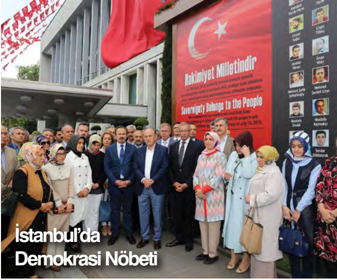
İstanbul'da Demokrasi Nöbeti

15 Temmuz Demokrasi ve Milli Birlik Günü etkinlikleri kapsamında İstanbul Büyükşehir Belediyesi önünde düzenlenen demokrasi nöbetinde Başkan Kadir Topbaş da nöbet tuttu. İstanbul Büyükşehir Belediye Başkanı Kadir Topbaş, 15 Temmuz darbe girişiminin olduğu gece çok acılar yaşandığını söyledi. Özgürlüğün ve demokrasinin o gece sinandığına vurgu yapan Başkan Topbaş, "İç ve dış mihraklar 15 Temmuz senaryosunu hazırladılar. Hiç hesap etmediler ki bu millet geçmişte Malazgirt'te, Sakarya'da, Dumlupınar'da, Çanakkale'de destanlar yazmış bir millet. Tekrar destan yazabileceğini hiç akıl edemediler. Milletimiz 80 milyonluk büyük bir aile. Vatan, demokrasi, milli irade ve bayrak söz konusu olduğu zaman gerisi teferruattır diyerek kol kola girmesini bildi ve dünyaya millet ne demektir gösterdi." dedi