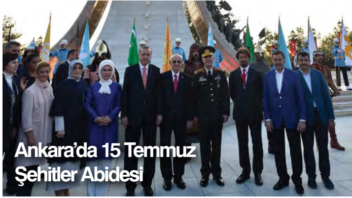
Ankara'da 15 Temmuz Şehitler Abidesi

Ankara Büyükşehir Belediyesi, 15 Temmuz darbe teşebbüsünün yıldönümü nedeniyle 1. Meclis'in bulunduğu Ulus Meydanı'ndan, 15 Temmuz Kızılay Milli İrade Meydanı istikameti üzerinden Türkiye Büyük Millet Meclisi'ne kadar yürüyüş düzenledi. Ankara Büyükşehir Belediye Başkanı Melih Gökçek, "15 Temmuz Kızılay Milli İrade Meydanı, Türkiye Büyük Millet Meclisi'nin önü dolmuş, Ankara'nın dört bir tarafı ayakta. Sağ olun, var olun." dedi. Ankara Büyükşehir Belediyesi tarafından 24 gün gibi rekor bir sürede yapımı tamamlanan '15 Temmuz Şehitler Abidesi'nin açılışını ise Cumhurbaşkanı Recep Tayyip Erdoğan yaptı.