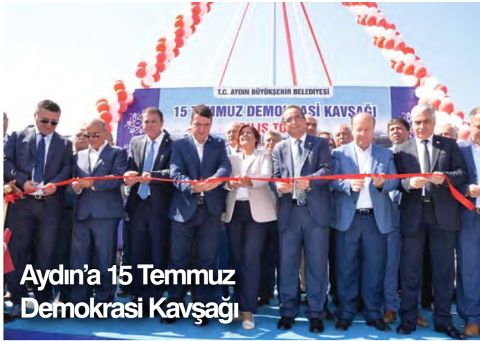
Aydın'a 15 Temmuz Demokrasi Kavşağı

Ankara Büyükşehir Belediyesi, 15 Temmuz darbe teşebbüsünün yıldönümü nedeniyle 1. Meclis'in bulunduğu Ulus Meydanı'ndan, 15 Temmuz Kızılay Milli İrade Meydanı istikameti üzerinden Türkiye Büyük Millet Meclisi'ne kadar yürüyüş düzenledi. Ankara Büyükşehir Belediye Başkanı Melih Gökçek, "15 Temmuz Kızılay Milli İrade Meydanı, Türkiye Büyük Millet Meclisi'nin önü dolmuş, Ankara'nın dört bir tarafı ayakta. Sağ olun, var olun." dedi. Ankara Büyükşehir Belediyesi tarafından 24 gün gibi rekor bir sürede yapımı tamamlanan '15 Temmuz Şehitler Abidesi'nin açılışını ise Cumhurbaşkanı Recep Tayyip Erdoğan yaptı.