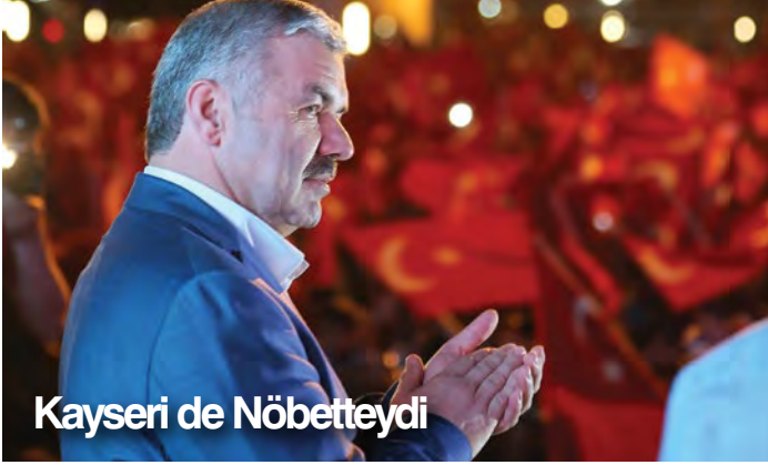
Kayseri de Nöbeteydi

15 Temmuz Demokrasi ve Milli Birlik Günü etkinlikleri kapsamında İstanbul Büyükşehir Belediyesi önünde düzenlenen demokrasi nöbetinde Başkan Kadir Topbaş da nöbet tuttu. İstanbul Büyükşehir Belediye Başkanı Kadir Topbaş, 15 Temmuz darbe girişiminin olduğu gece çok acılar yaşandığını söyledi. Özgürlüğün ve demokrasinin o gece sinandığına vurgu yapan Başkan Topbaş, "İç ve dış mihraklar 15 Temmuz senaryosunu hazırladılar. Hiç hesap etmediler ki bu millet geçmişte Malazgirt'te, Sakarya'da, Dumlupınar'da, Çanakkale'de destanlar yazmış bir millet. Tekrar destan yazabileceğini hiç akıl edemediler. Milletimiz 80 milyonluk büyük bir aile. Vatan, demokrasi, milli irade ve bayrak söz konusu olduğu zaman gerisi teferruattır diyerek kol kola girmesini bildi ve dünyaya millet ne demektir gösterdi." dedi