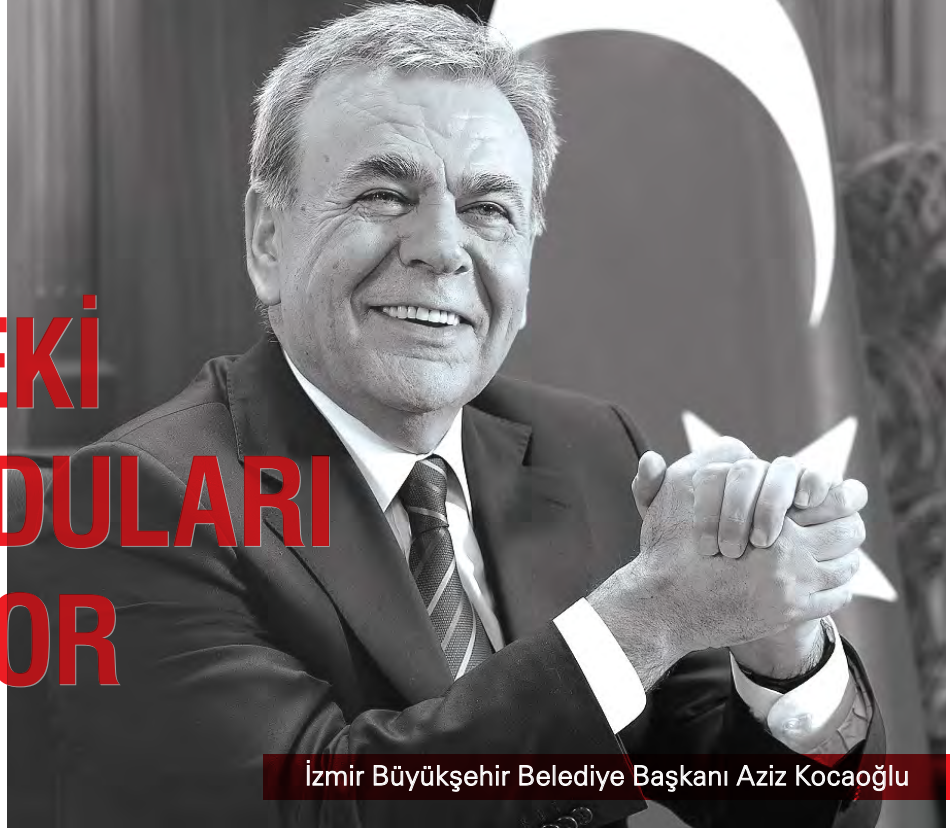
İzmir Büyükşehir Belediye Başkanı Aziz Kocaoğlu

Tarihin bize anlatacakları ve hatta yaşatacakları var. Pek çok kentte üzerine gecekondu, yollar, biçimsiz yapılar inşa ettiğimiz tarih, bu konuda hassasiyeti olan yerel yöneticiler tarafından özenle gün yüzüne çıkartılıyor. Şimdilerde İzmir’de de benzer bir çalışma yürütülüyor. İzmir Büyükşehir Belediye Başkanı Aziz Kocaoğlu, kentin tarihi zenginliğini büyütecek çok önemli bir yapıyı daha, üzerindeki gecekonduların karanlığından kurtarmaya odaklanmış durumda.