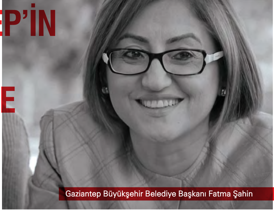
Gaziantep Büyükşehir Belediye Başkanı Fatma Şahin

Doğanın farklı hazineler bakımından başka kentlere göre çok daha cömert olduğu kentler var. Günümüzde güneş enerjisi diye bir hazine var. Gaziantep Büyükşehir Belediye Başkanı Fatma Şahin de bu hazineyi kentin yararına kullanmak ve kentin iklimsel avantajını büyük bir ekonomik değere dönüştürmek üzere harekete geçti. Proje tamamlandı. İlk üretim başladı. Hedef ise her geçen sürede daha iyisini, daha fazlasını başarabilmek.