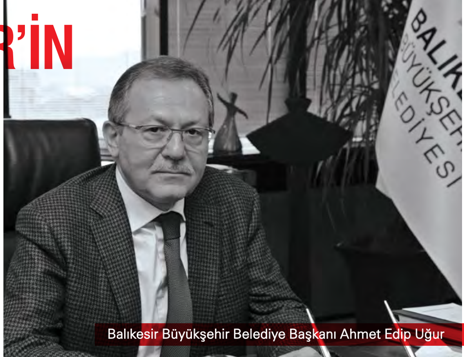
Balıkesir Büyükşehir Belediye Başkanı Ahmet Edip Uğur

Bir kenti mutlu edecek, o kentte hayatı güzelleştirecek, o kente çok daha fazla turist getirecek yatırımların en önemlilerinden biri de kentin kolay ulaşılabilir bir yerinde büyük bir nefes alanı yaratmaktır. Balıkesir Büyükşehir Belediye Başkanı Ahmet Edip Uğur, kentteki yaşamı pek çok açıdan ferahlatacak ve keyifli hale getirecek projesini hayata geçirmeyi başardı